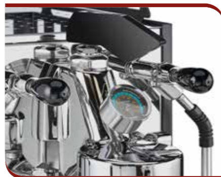
Flow control device